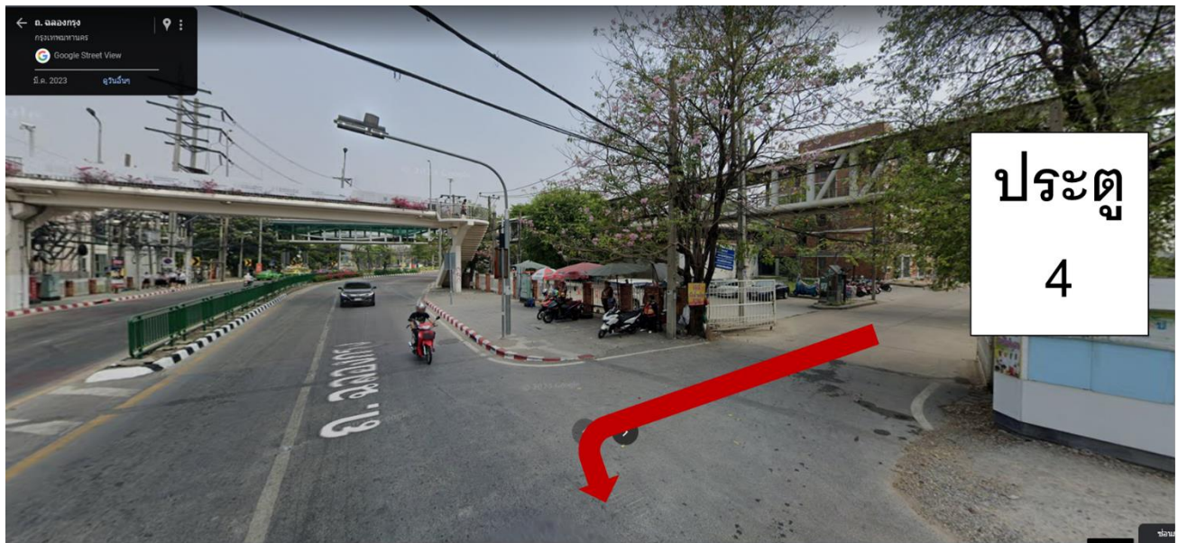
ออกจากประตู 4 แล้วข้ามทางรถไฟ เพื่อไปจอดรถที่หอประชุม 5000 ที่นั่ง