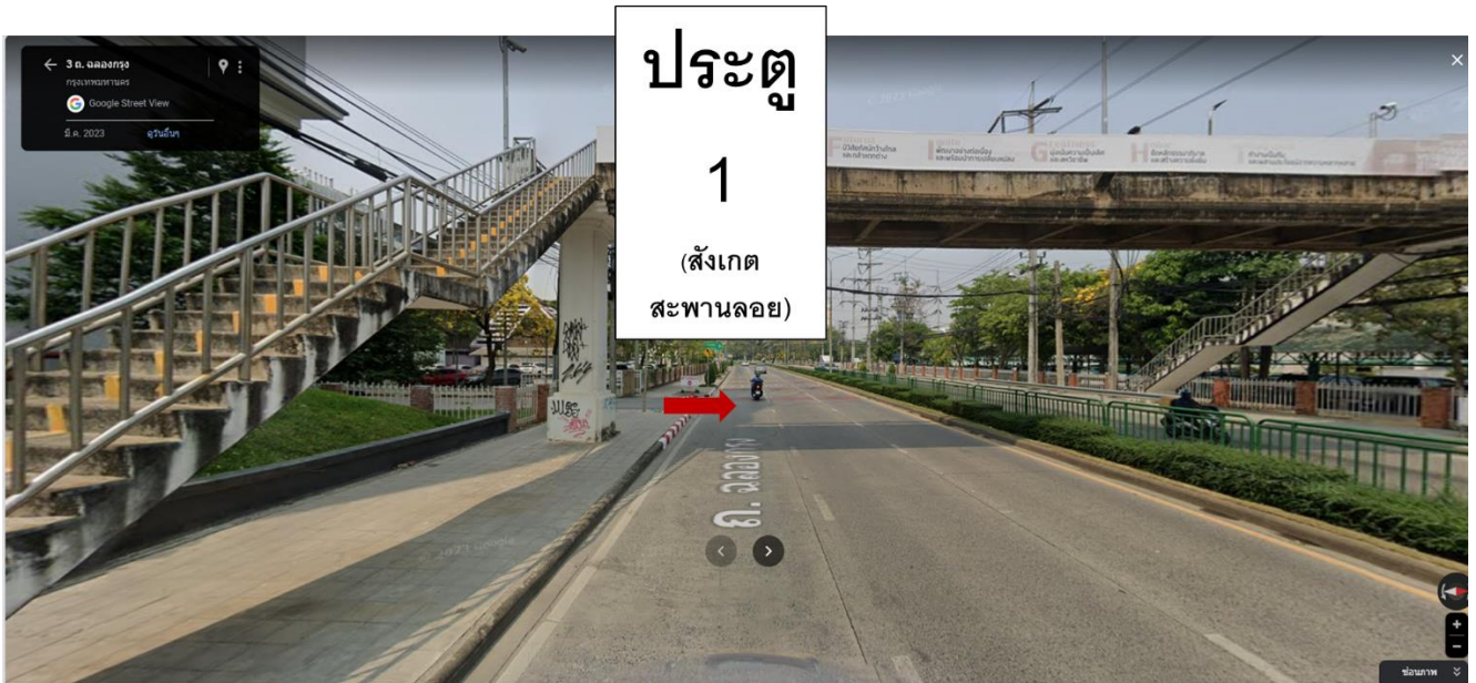
ประตู 1 ห้ามเข้า ใช้เป็นทางออกเพื่อไปจอดรถที่หอประชุม 5000 ที่นั่ง